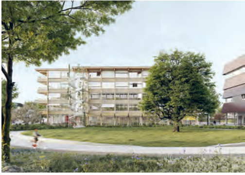
1 Visualisierung: pool Architekten und Jeudi.Wang