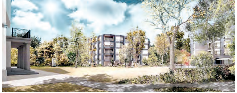
2 Visualisierung: Meyer Gadiant