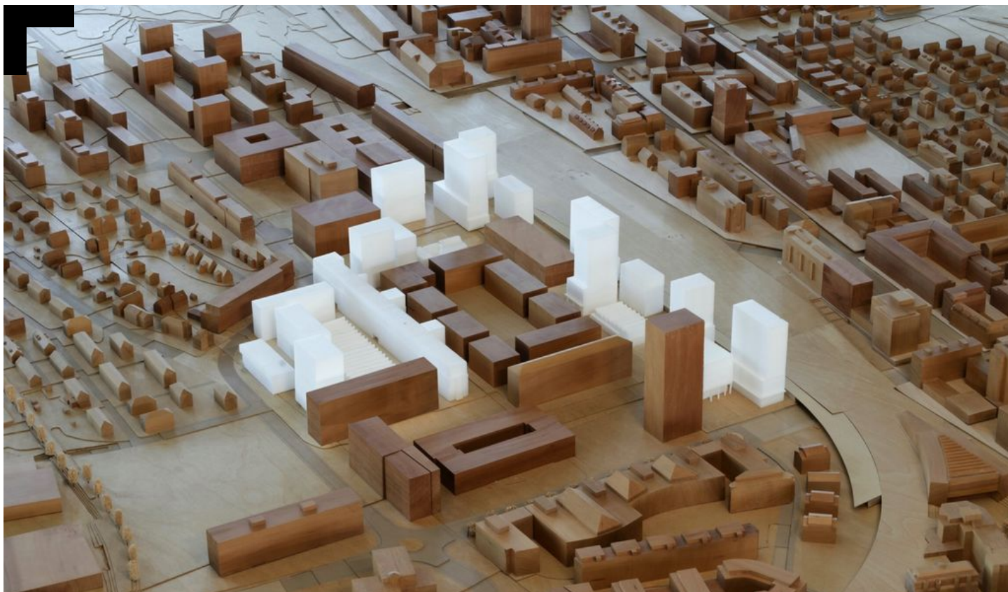
Das Richtkonzept für das LG-Areal im Stadtmodell